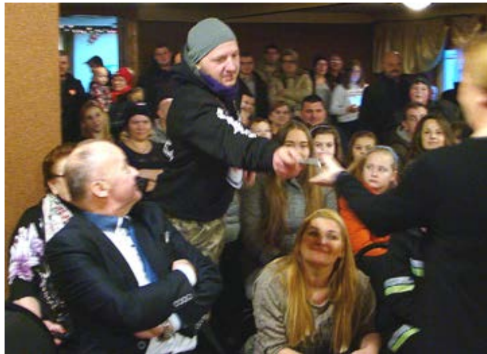
Główna część niedzielnej akcji odbyła się pod jasięńskim domem kultury, gdzie można było spotkać motocyklistów z Klubów Riders of Flames oraz Blue Knights, a także samochody terenowe. W środku występowały dzieci z sekcji wokalne MGOK oraz prowadzono licytację przedmiotów przekazanych przez sponsorów.