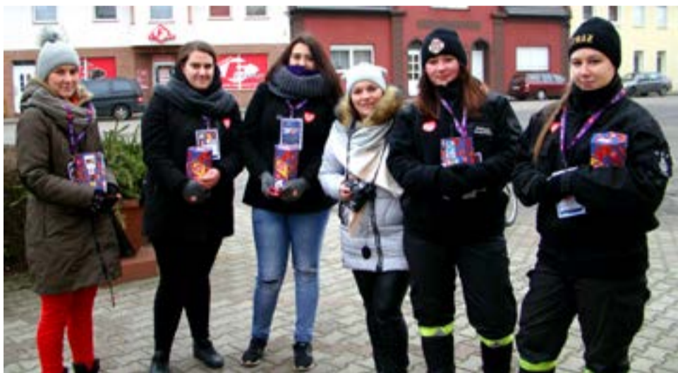
Od rana na ulicach można było spotkać wolontariuszy.

14.080 zł to wynik 26 Finału WOŚP w Jasieniu