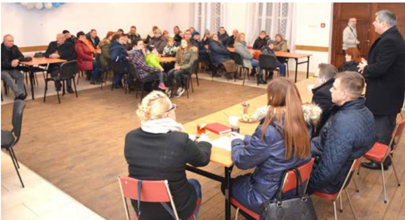
Mieszkańcy Mierkowa opowiedzieli się za przeniesieniem świetlicy do kontenerów.