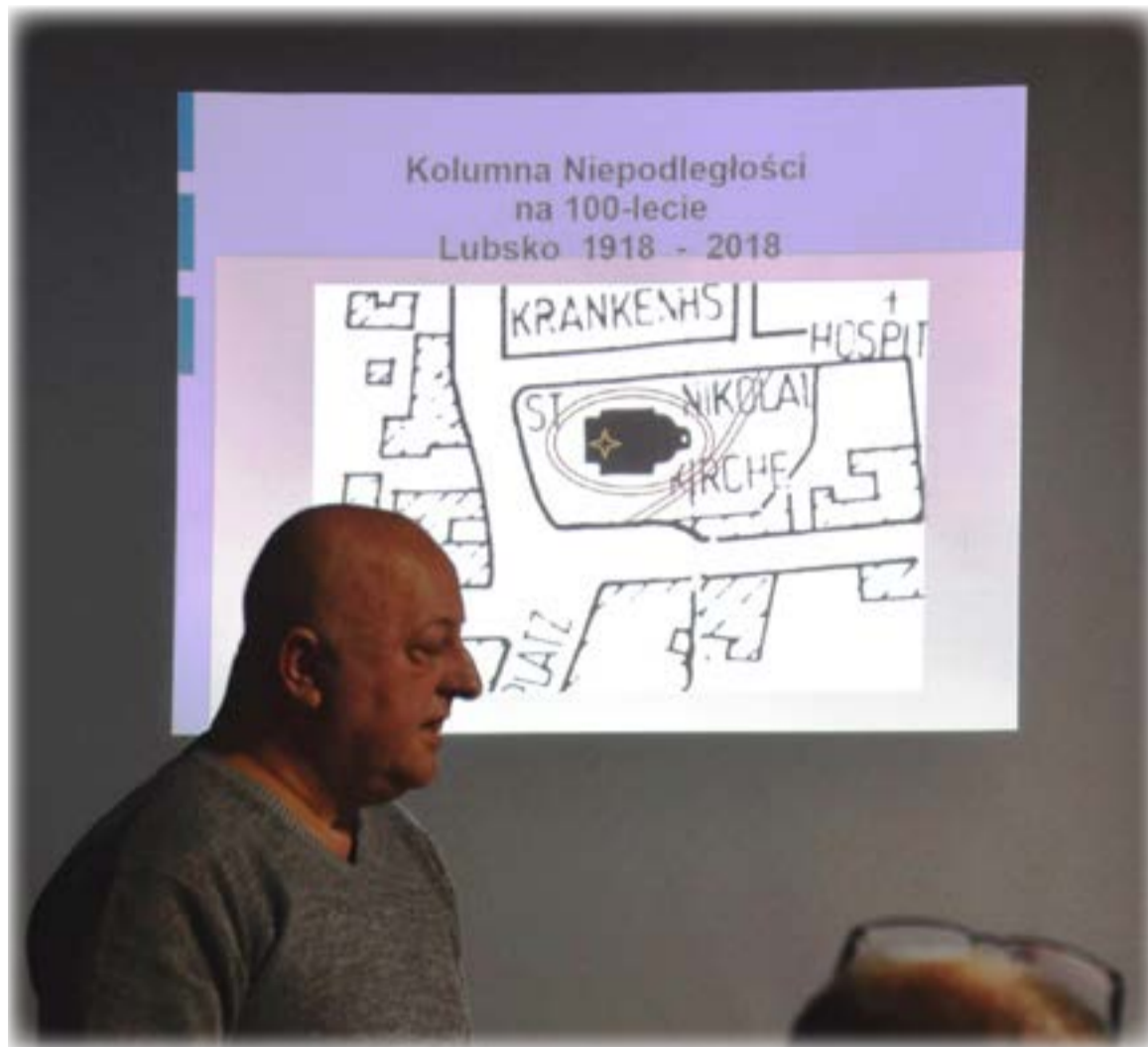
Do lat 60-tych XX wieku na wzgórzu stał kościół św. Mikołaja