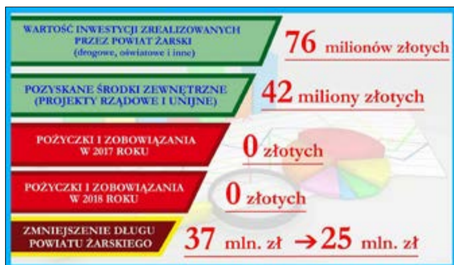
Osiągnięcia Rady Powiatu Żarskiego w obecnej kadencji

jemy warsztaty. Młodzież to nasza polisa na przyszłość. Bardzo ważne są dla mnie sprawy społeczne: ludzie potrzebujący wsparcia, pomocy urzędu. Inwestujemy więc w Domy Pomocy Społecznej, Domy Dziecka, Powiatowy Szpital Na Wyspie w Żarach i w Lubsku. Robię wszystko, by moje marzenie o szpitalu świadczącym usługi na najwyższym poziomie ziściło się.