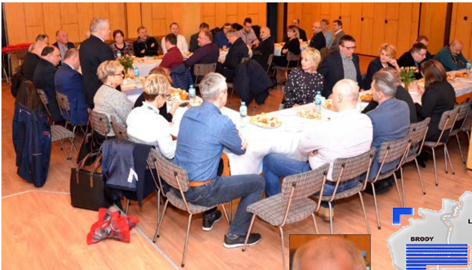
W spotkaniu uczestniczyli radni i działacze Forum Samorządowego, PIS, PSL oraz przedsiębiorcy

Podsumowanie trzech lat pracy Forum Samorządowego i plany na wybory samorządowe. To główne tematy spotkania radnych, przedsiębiorców i działaczy, w poniedziałek 8 stycznia w Lubsku.