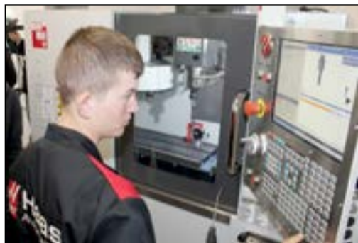
Nowoczesne wyposażenie warsztatów szkolnych w CKZiU w Żarach, to "przepustka" dla uczniów, do otrzymania atrakcyjnej pracy