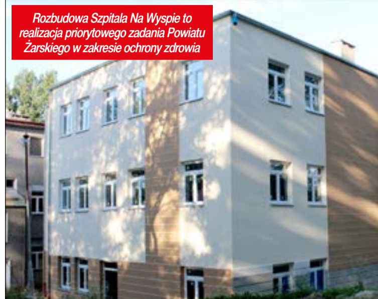
Rozbudowa Szpitala Na Wyspie to realizacja priorytowego zadania Powiatu Żarskiego w zakresie ochrony zdrowia