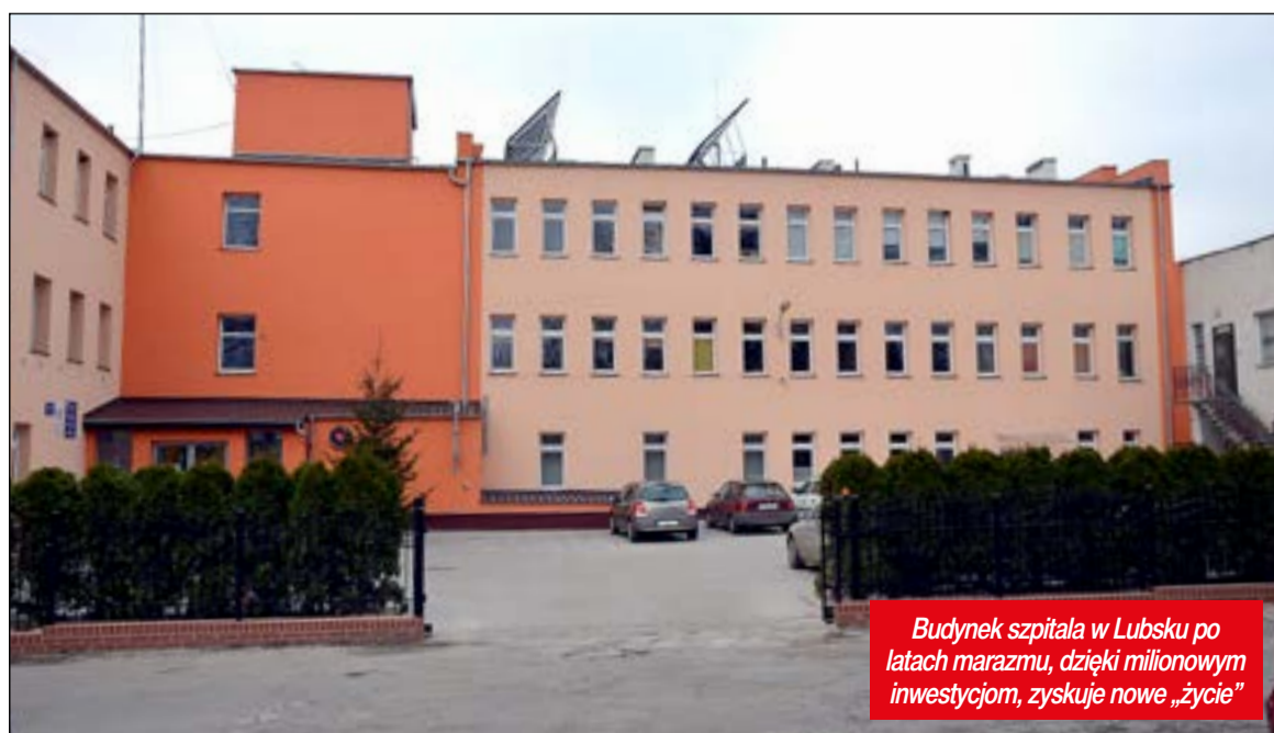
Budynek szpitala w Lubsku po latach marazmu, dzięki milionowym inwestycjom, zyskuje nowe „życie”

Na inwestycje w 2018 roku mamy ponad 22 miliony złotych. Planujemy wymienić dach i przebudować taras w Domu Pomocy Społecznej w Lubsku. W Górzynie i w Piotrowie będą przebudowane drogi powiatowe, pozyskaliśmy na to pieniądze od Wojewody. Kończymy ścieżkę pieszo-rowerową nad zalewem Karaś w Lubsku. W Specjalnym Ośrodku Szkolno-Wychowawczym w Lubsku przeprowadzimy remont pomieszczeń sanitarno-higienicznych. Zwiększamy kapitał zakładowy Szpitala Na Wyspie w Żarach o półtora miliona złotych. W dalszym ciągu przebudowujemy kolejne warsztaty szkolne w CKZiU. Mam nadzieję, że budynek Zespołu Szkół Ekonomicznych w Żarach doczeka się termomodernizacji. Zaplanowaliśmy także inwestycje w gminie Brody i w Tuplicach - wskazuje Starosta Janusz Dudoić.