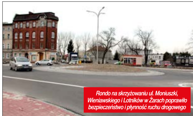
Rondo na skrzyżowaniu ul. Moniuszki, Wieniawskiego i Lotników w Żarach poprawiło bezpieczeństwo i płynność ruchu drogowego