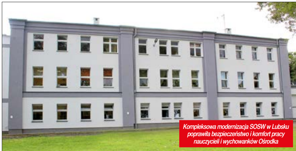
Kompleksowa modernizacja SOSW w Lubsku poprawiła bezpieczeństwo i komfort pracy nauczycieli i wychowanków Ośrodka