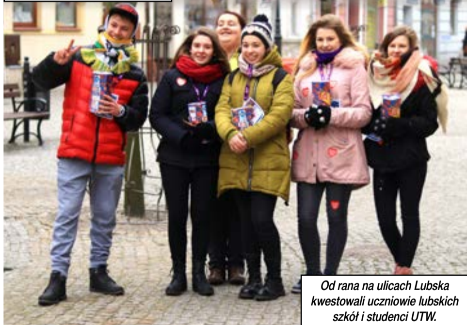
Od rana na ulicach Lubuska kwestowali uczniowie lubuskich szkół i studenci UTW.

Taką kwotę, w czasie 26 finału WOŚP, udało się nazbierać w Lubsku.